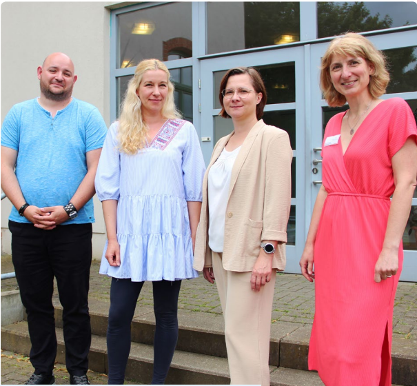
Vereinbaren Sie Ihr persönliches Beratungsgespräch. Das Team unseres Beratungszentrums freut sich auf Sie.

Die Beraterinnen und Berater nehmen sich Zeit, beantworten jede Frage offen und ehrlich und unterstützen bei Anträgen, Zuzahlungen und Korrespondenzen.