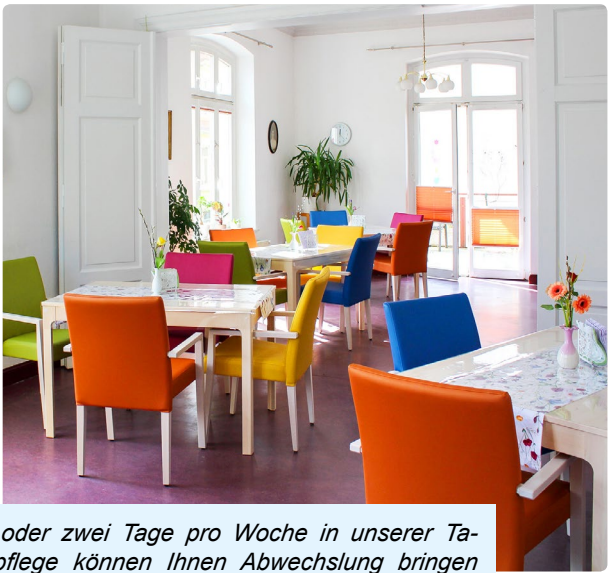
Ein oder zwei Tage pro Woche in unserer Tagespflege können Ihnen Abwechslung bringen und Ihren Angehörigen Entlastung. Besichtigen Sie das schöne Wittrock-Haus gern vorher und informieren Sie sich über die Angebote.

Die Entscheidung, Hilfe in Anspruch zu nehmen oder sogar in ein Alten- und Pflegeheim zu ziehen, ist nie leicht und muss gut überlegt sein. Deshalb können Sie unsere Einrichtungen auch vorher besuchen, sich umschaun und alle Fragen stellen, die Ihnen wichtig sind.