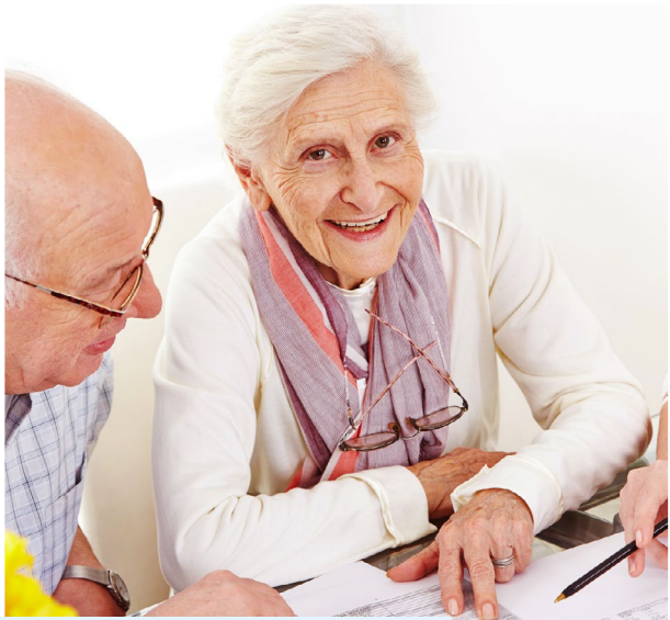
Wir beraten Sie transparent und erläutern Ihnen alle Punkte des Vertrages.

Sollten Sie sich für eines unserer Angebote entscheiden, steht am Ende ein Vertrag, der alle Leistungen konkret regelt. Hier erwarten Sie keine versteckten Kosten.