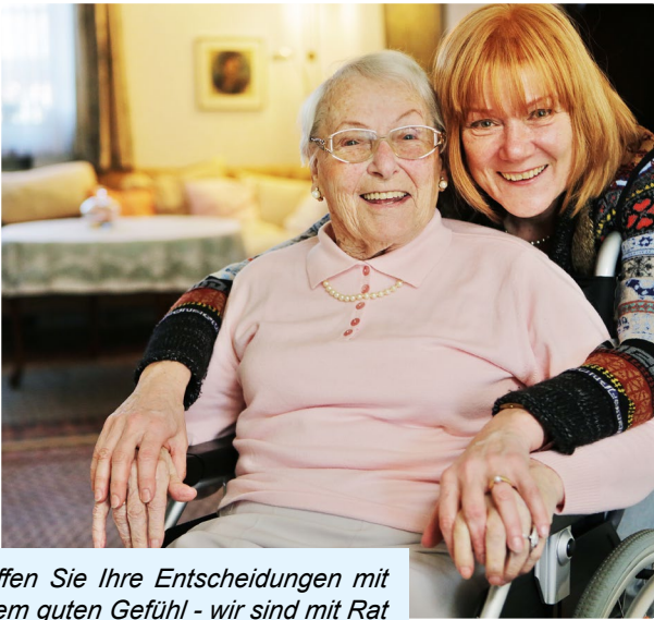
Treffen Sie Ihre Entscheidungen mit einem guten Gefühl - wir sind mit Rat und Hilfe an Ihrer Seite.

Für die Beantwortung Ihrer Fragen stehen wir Ihnen gern zur Verfügung. In unserem Netzwerk für Menschen vereinen wir alle Angebote der Altenhilfe. Unsere Einrichtungen sind in ganz Schwerin verteilt, so dass jeder ein wohnortnahes Angebot findet.